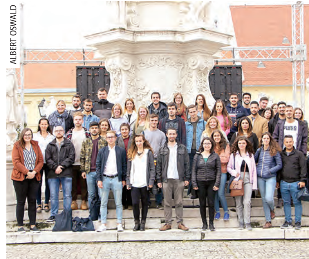
Dio inozemnih studenata koji su se okupili na Erasmus+ Welcome Day u Osijeku

studentske mreže (Erasmus Student Network - ESN) Osijek već su tradicionalno predstavili svoje aktivnosti i pomoć koju pružaju stranim studentima. U zimskom semestru dolazni su studenti stigli iz ukupno 17 zemalja svijeta, a najviše je studenata s partnerskih sveučilišta iz Portugala (12), Španjolske (8), Turske (8) i Makedonije (8). Studenti će studirati ili obavljati stručnu praksu na sljedećim sastavnicama: Medicinskom fakultetu (14), Ekonomskom fakultetu (11 studenata), Filozofskom fakultetu (10), Fakultetu elektrotehnike, računarstva i informacijskih znanosti (7), Pravnom fakultetu (6), Akademiji za umjetnost i kulturu (6), Fakultetu agrobiotehničkih znanosti (4), Prehrambeno-tehnoološkom fakultetu (4), Fakultetu dentalne medicine i zdravstva (2), Strojarskom fakultetu u Slavonskom Brodu (2) te Odjelu za biologiju (1).