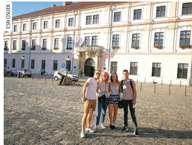
Erasmus studenti ispred zgrade Sveučilišta u Osijeku tijekom aktivnosti Welcome Weeka