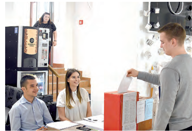
Redovni studentski izbori na Sveučilištu provedeni su 6. lipnja 2019.