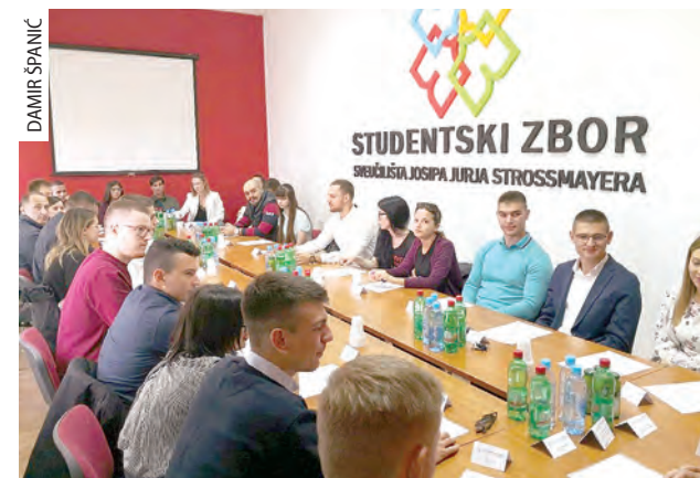
Konstituirajuća sjednica novog saziva Skupštine Studentskog zbora

● Na nacionalnoj razini Hrvatski studentski zbor, koji predstavlja svih otprilike 170 000 studenata, sudjeluje, predlaže i imenuje svoje predstavnike u sva povjerenstva i radne skupine Ministarstva znanosti i obrazovanja RH koje se osnivaju radi unaprjeđivanja i funkcioniranja sustava visokoga obrazovanja i studentskoga standarda. Također, Hrvatski studentski zbor predlaže ili imenuje predstavnike i u tijela Agencije za znanost i visoko obrazovanje, Nacionalnu skupinu za provedbu kurikularne reforme, Rektorski zbor Republike Hrvatske i ostala tijela prema zakonu te propisima nadležnih institucija.