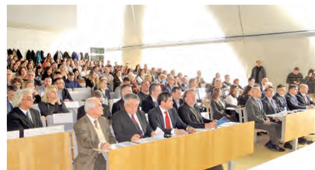
Svečano otvorenje 8. međunarodne konferencije Voda za sve 2019.