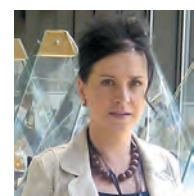
Pripremila: Lidija Getto