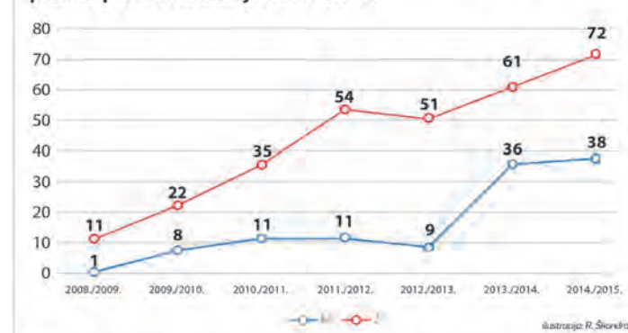
Prikaz odlazne mobilnosti studenata Sveučilišta u Osijeku prema spolu za razdoblje 2008.-2015.

Nedavno je otvoren novi natječaj za mobilnost studenata Sveučilišta u Osijeku. Sve informacije dostupne su na ovoj adresi: http://www.unios.hr/?g=5&i=179 .